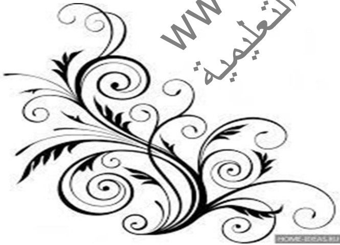
٢- التشابك .....